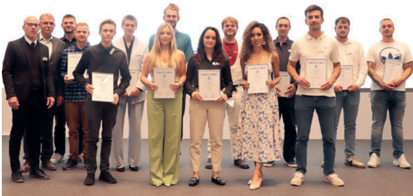
Legten die besten Gesellenprüfungen ab: die Innungssiegerinnen und Innungssieger aus den verschiedenen Gewerken.