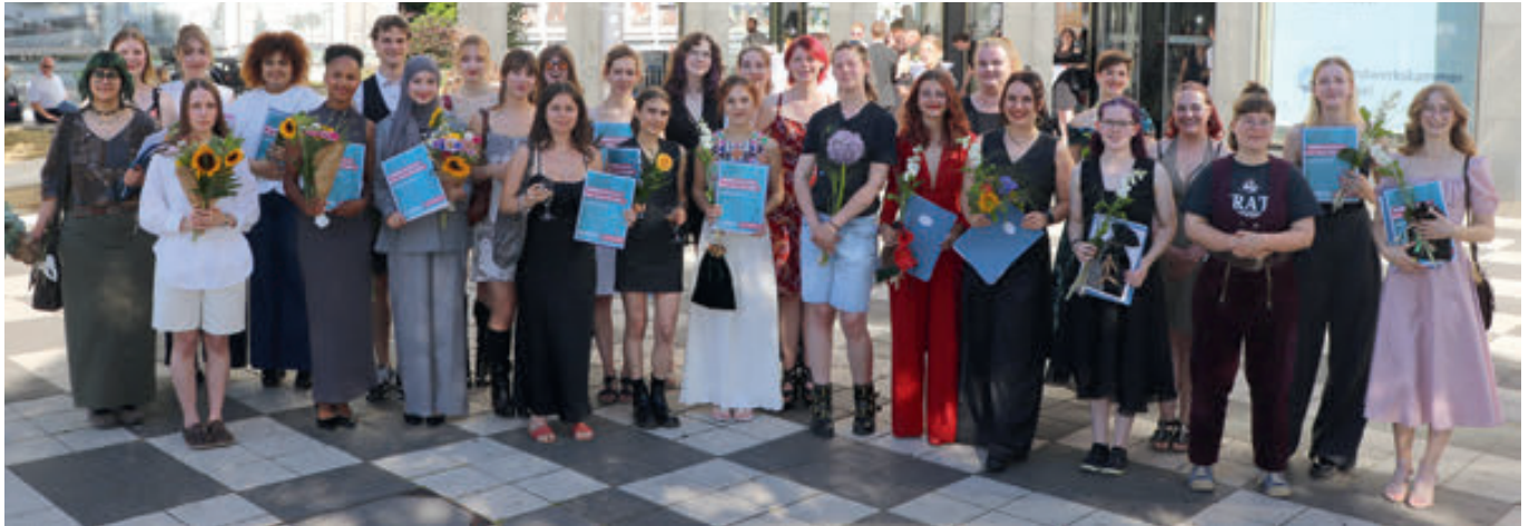
Freuen sich über ihren erfolgreichen Ausbildungsabschluss: Die neuen Maßschneidergesellinnen und -gesellen.