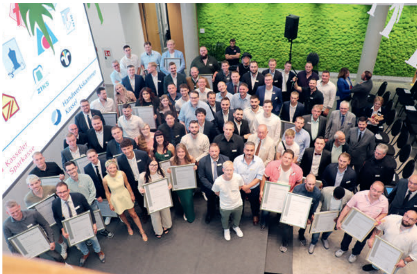
Ein Erinnerungsfoto mit den neuen Meisterinnen und Meister im Handwerk.