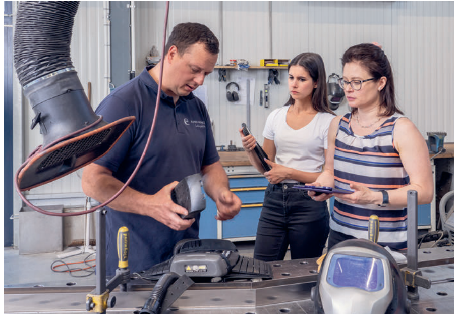
Es werden nicht nur Dokumente und Zertifikta geprüft sondern auch ein Betriebsrundgang durchgeführt, um sich die Situation an den Arbeitsplätzen anzuschauen.

Die Beamten dürfen verlangen, dass der Arbeitgeber oder eine von ihm beauftragte Person sie bei einem Kontrollgang begleitet und unter-