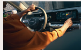
Connected Car Navigation Cockpit (ccNC)