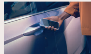
Digitaler Fahrzeugschlüssel 2,3