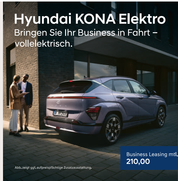
Abb. zeigt ggf. aufpreispflichtige Zusatzausstattung.

Nachhaltig, innovativ, effizient: Was ein modernes Unternehmen erfolgreich macht, zeichnet auch den Hyundai KONA Elektro aus. Er bringt Sie vollelektrisch bis zu 514 km weit 1 , ist dabei ohne lokale Emissionen unterwegs und überzeugt mit vielen innovativen Technologien. So sind Sie mit dem Autobahnassistenten 2.0 2 teilautonom unterwegs, parken dank Einparkassistent mit Fernbedienung 2 vollautomatisch ein und können den Hyundai KONA Elektro mit dem Digitalen Fahrzeugschlüssel 2,3 sogar per Smartphone ent- und verriegeln. Kurz: ein Fahrzeug, das auch Ihr Unternehmen auf Zukunftskurs bringt.