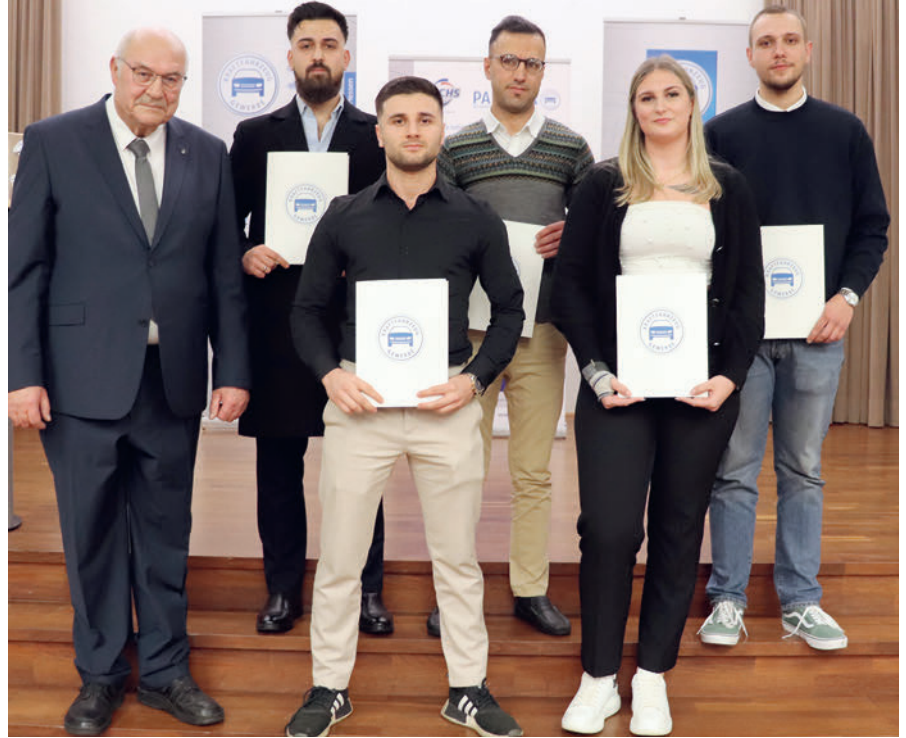
Gesellenbriefe und Zeugnisse für die Karosseriebauer.