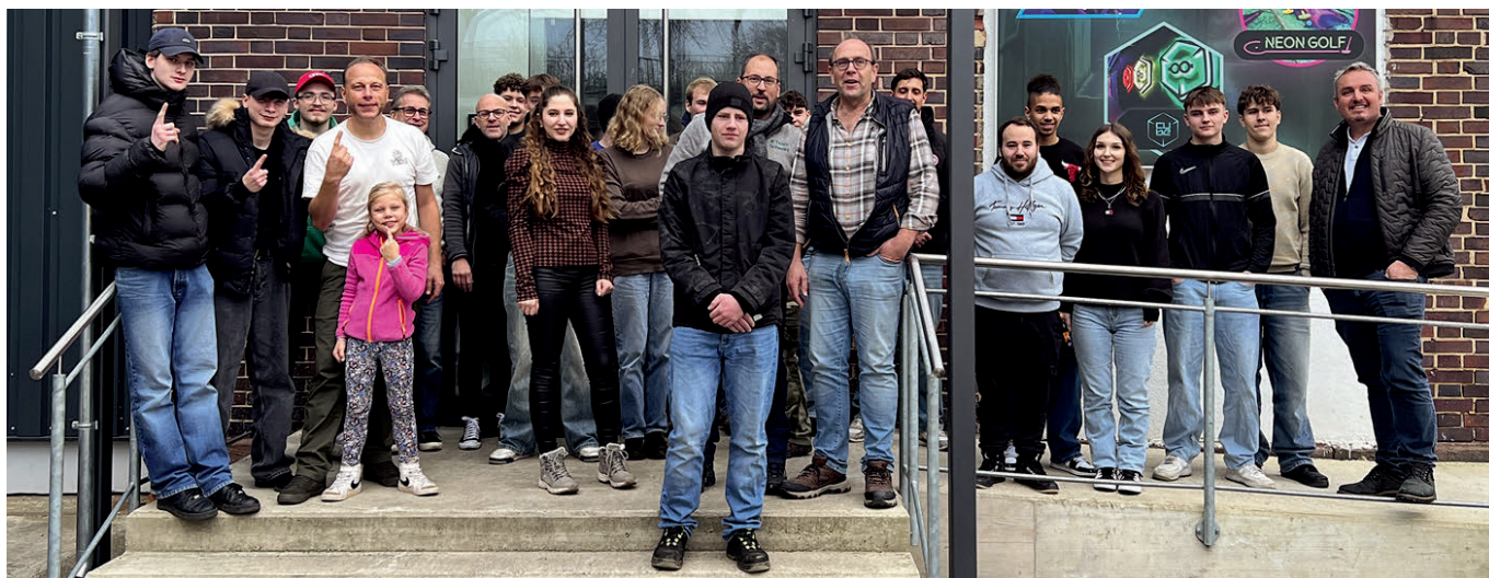
Mit Geschicklichkeit und Grips knackten Azubis und Ausbilder die Rätsel.

Nach den spannenden Räseln war es Zeit, die Energiespeicher wieder aufzufüllen – gemeinsam ließ man den Tag bei Pizza und guten Gesprächen ausklingen.